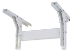
120540 Stelaż do pojedynczych aparatów o regulacji wys. w zakresie 26-87 cm, dla sufitów o wysokości 266-327 cm.