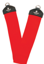
111002 Podwieszka wąska zakończona metalowym kółkiem, rozmiar 94,5 cm x 10 cm x 4,5 mm, max. obciążenie 100 kg.