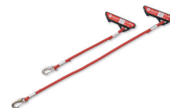
113001 Komplet 2 szt. linek elastycznych z mocowaniem, o dużym oporze, dł. 30cm, kolor czerwony, max. obciążenie 50 kg.