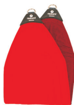
111001 Podwieszka szeroka zakończona metalowym kółkiem, strona wewnętrzna pokryta warstwą antypoślizgową, rozmiar 85 cm x 23,5 cm x 5 mm, max. obciążenie 100 kg.