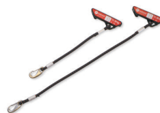
113002 Komplet 2 szt. linek elastycznych z mocowaniem, o małym oporze, dł. 30 cm, kolor czarny, max. obciążenie 30 kg.