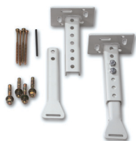
120511 Stelaż do pojedynczych aparatów o regulacji wys. w zakresie 15-25 cm, dla sufitów o wysokości 260-270 cm.