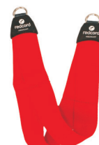
111003 Podwieszka dzielona zakończona metalowym kółkiem, rozmiar 73 cm x 10 cm x 3 mm, max. obciążenie 100 kg.

Uwaga: pranie mechaniczne w temperaturze do 60°C, dla podwieszki szerokiej do 40°C