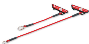
112001 Komplet 2 szt. linek zwykłych z mocowaniem, dł. 30cm, kolor czerwony, max. obciążenie 150 kg.