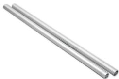
120220-30 do 120220-120 Dodatkowe nóżki do mocowania stelażu o dł. od 30 do 120 cm.